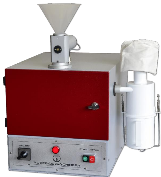
HAMMER MILL - Y17