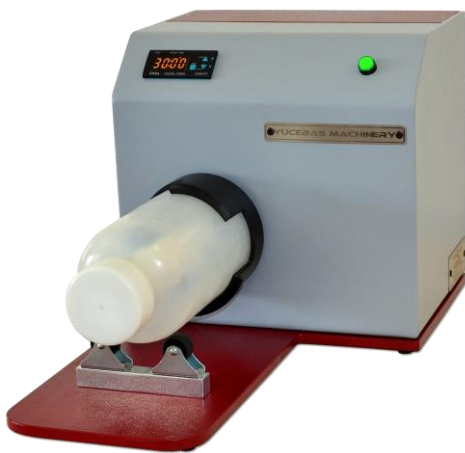
WHEAT HUMIDIFICATION MIXER